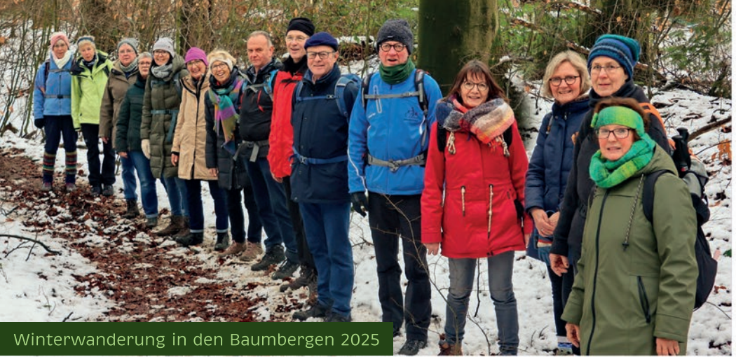
Winterwanderung in den Baumbergen 2025