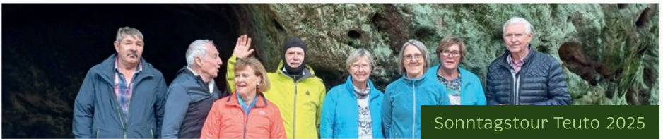
Sonntagstour Teuto 2025