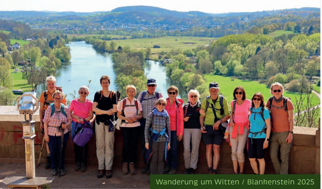
Wanderung um Witten / Blankenstein 2025