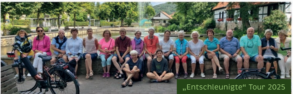
„Entschleunigte“ Tour 2025